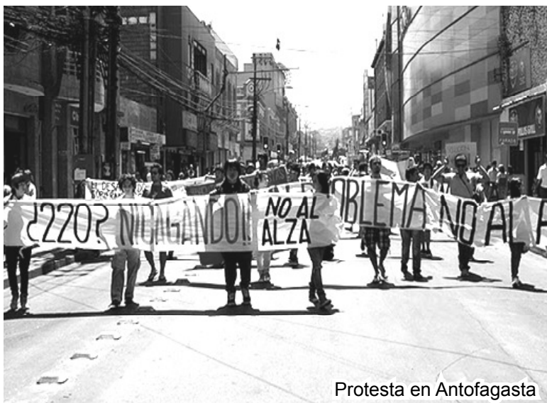
Protesta en Antofagasta

27 de Febrero: en el sur de Chile este día fue para miles de populares un día de conme- moración y de protesta. Es que la reconstrucción va más lento que caracol con asma y las migajas del poder no resuelven en nada las necesidades de miles de hombres y mujeres, que a un año del terremoto todavía viven en mediaguas... el 26 de Febrero en Concepción la Red Construyamos convocó a una marcha en la Plaza Perú, en la cuál asistieron más de 2.000 personas, la cuál se dirigió ha- cia la Plaza de Armas de la ciu- dad, en donde se realizó un acto político cultural. Posteriormente en la tarde se llevaron a cabo distintas actividades, como la realizada en el Estadio El Mo- rro de Talcahuano convocada por el Partido de los Trabajadores. Para la noche del 26 de