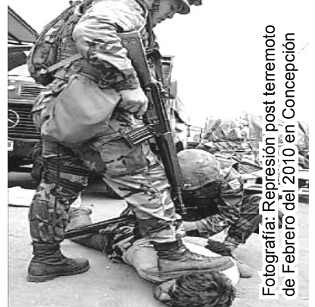
Fotografía: Represión post terremoto de Febrero del 2010 en Concepción

En el nuevo capitalismo la ganancia se había recuperado, ahora el 30% se destinaba a