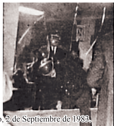
Quema de bancos, el Mercurio, 2 de Septiembre de 1983.