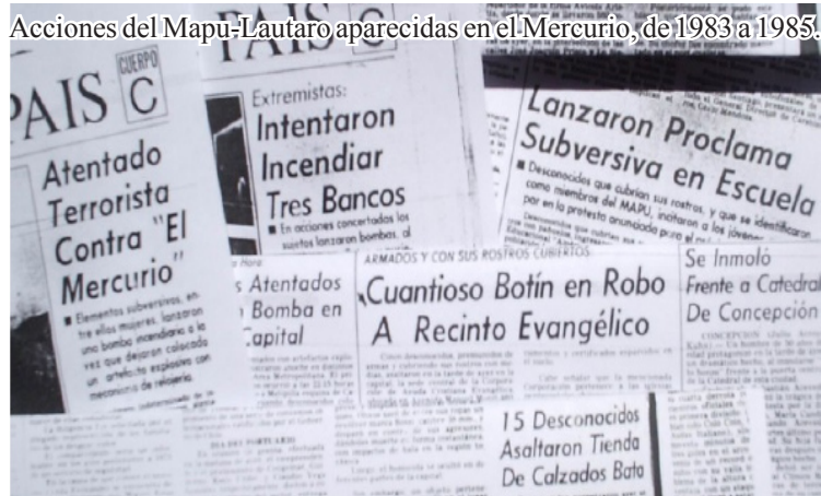
Acciones del Mapu-Lautaro aparecidas en el Mercurio, de 1983 a 1985.

Con esta serie de acciones el M.J. Lautaro se adelanta a mostrar una vez más su disposición de luchar con todo (piedras, palos, molotov, armamento casero, etc.) contra la Dictadura y le muestra al Pueblo cuales son los objetivos centrales de la lucha popular: los pilares del régimen.”