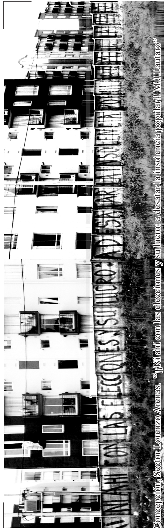
Concepción, Sector Lorenzo Arenas. “¡¡NI AHÍ CON LAS ELECCIONES Y SU LUCRO: A DESAJAR LA INSOLENCIA POPULAR!! M.J.L. LAUTARO”

Fuego en cada calle, fuego en cada pasaje. Unos buscando colchones viejos y neumáticos para quemar, otros preparando los materiales para resistir y desalojar a la represión de la población, “cada uno en la suya, pero todos en la misma” . Es la generación del “Pueblo en Llamas” , una generación de jóvenes populares que se hizo subversiva para pirar a la dictadura y para vivir en plenitud. Del calor de las protestas de inicios de los ochenta y en las orgías del Pueblo en Llamas es de donde nace el MJL, “instrumento del pueblo rebelde”, lanzándose en las esquinas populares con la consigna “¡¡JUVENTUD POPULAR: A LUCHAR!!” .