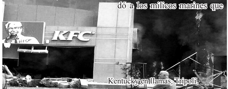
Kentucky en llamas, Tripoli.

La protesta no se hizo esperar, provocando revueltas que transformadas en turba golpearon al imperio en donde más les duele. Los hechos más trascendentes se produjeron en la embajada de EEUU en Libia, ciudad de Bengasi, donde una turba la atacó y desbordó a los milicos marines que