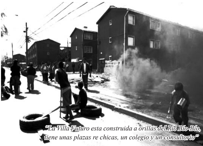
"La Villa Futuro esta construida a orillas del Río Bío-Bío, tiene unas plazas re chicas, un colegio y un consultorio"

Si me preguntaran dónde me gustaría haber nacido, sin duda hubiese elegido la "Villa Futuro".